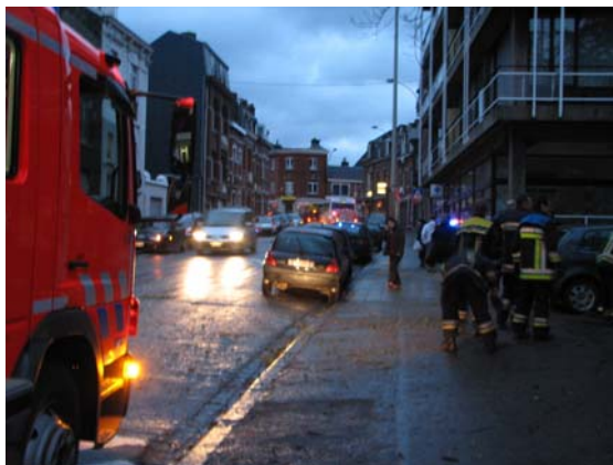
RUE DE CAMPINE. T.B.

A Sainte-Walburge très vulnérable en cas de rafales, les branches d'un arbre se sont abattues sur deux voitures, Clio et Polo, stationnées rue de Campine en face du parc Jean Lejeune - propriété de la Ville. Le véhicule de désincarcération, arrivé « en bourrasque », a tronçonné les branches dangereuses et déblayé le terrain avant de repartir dans les rafales: « Nous sommes débordés ».