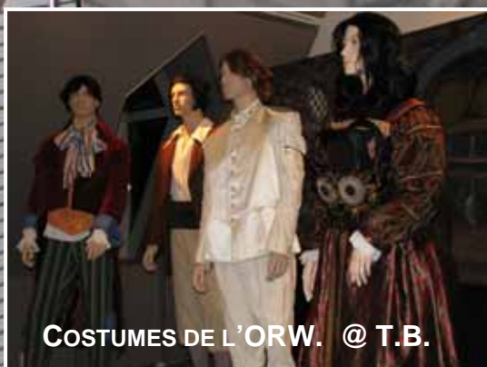
COSTUMES DE L'ORW. @ T.B.