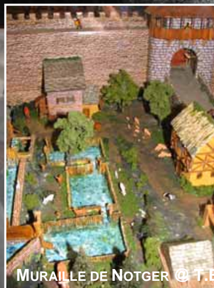
MURAILLE DE NOTGER @ T.B.