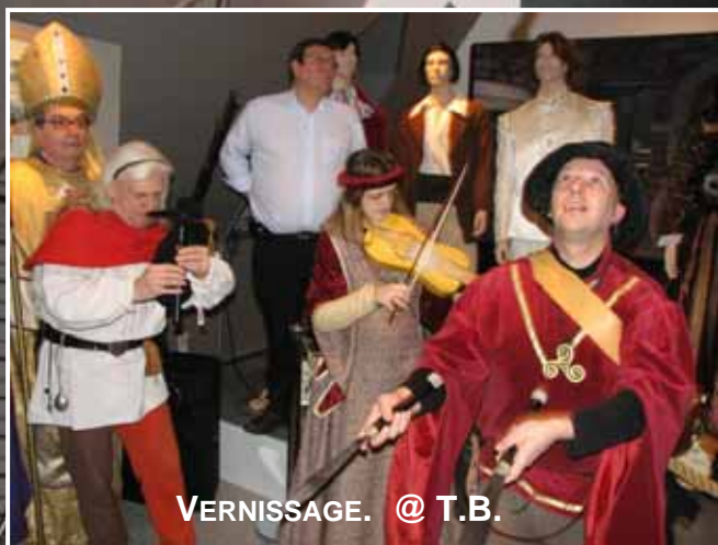
VERNISSAGE. @ T.B.