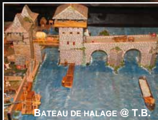
BATEAU DE HALAGE @ T.B.