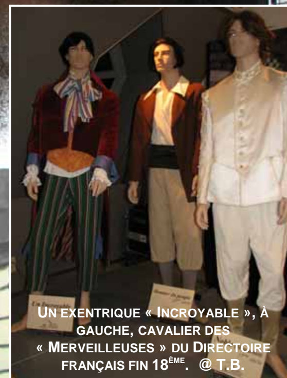
UN EXENTRIQUE « INCROYABLE », À GAUCHE, CAVALIER DES « MERVEILLEUSES » DU DIRECTOIRE FRANÇAIS FIN 18 ÈME .