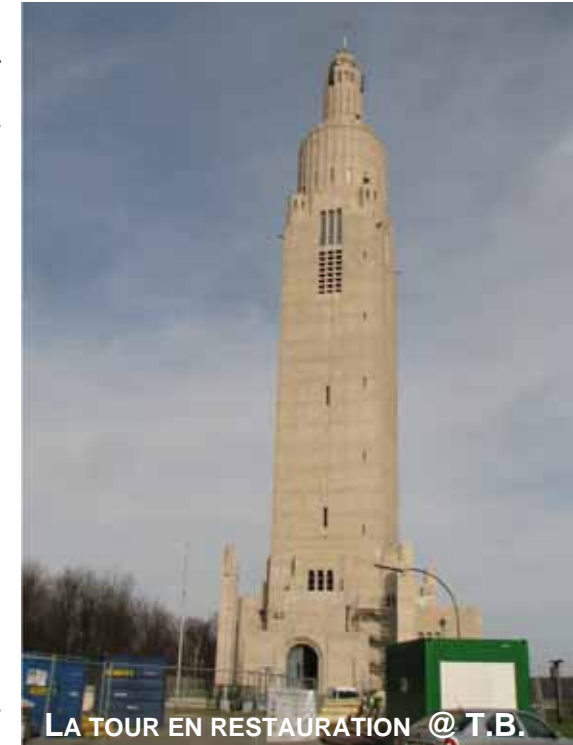
LA TOUR EN RESTAURATION @ T.B.

L'ancien président de l'Office du Tourisme de la Province rejette toutefois aujourd'hui un projet... touristique : « Il faut raison savoir garder. L'édifice n'est pas la Basilique du Sacré-Cœur à Montmartre. Il y a le panorama à partir de la tour. L'église ne drainera pas des cars avec des 100 aines de visiteurs par jour ». ♦