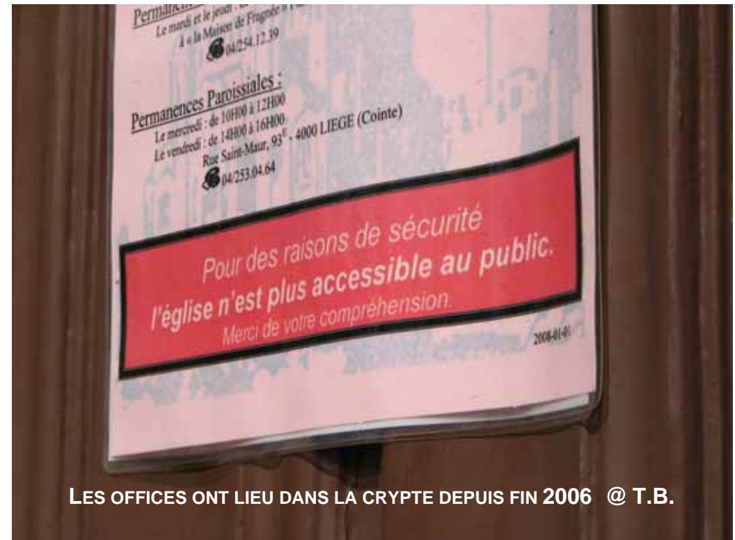
LES OFFICES ONT LIEU DANS LA CRYPTÉ DEPUIS FIN 2006 @ T.B.