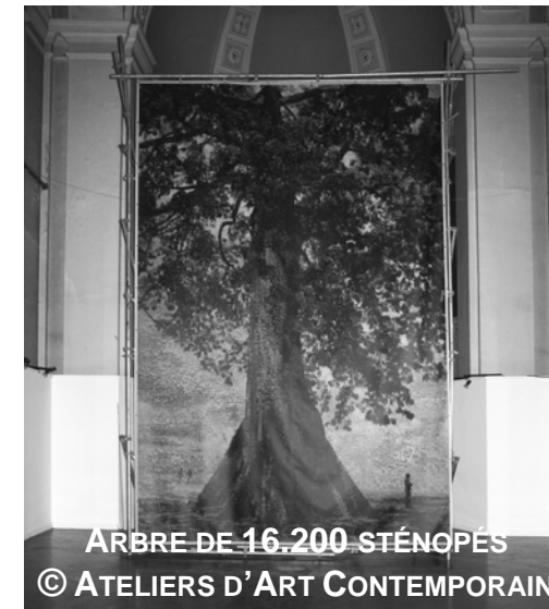
ARBRE DE 16.200 STÉNOPÉS